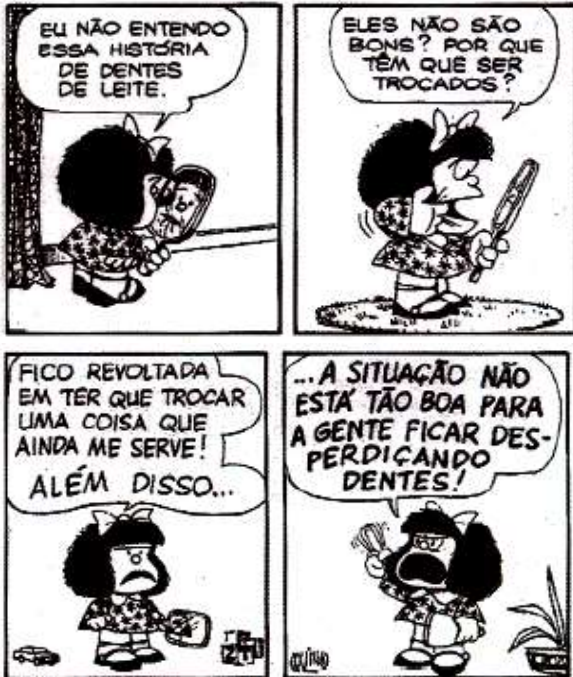
Toda Mafalda. Joaquim Salvador Lavado (Quino). São Paulo: Martins Fontes, 1993, p. 111.